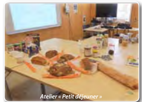
Atelier « Petit déjeuner »

Ces ateliers mêlant théorie et pratique ont recueilli un véritable succès. Ils ont réussi à améliorer la qualité de vie au travail des agents en apportant un bien-être psychique et physique qui permettent une meilleure efficacité et implication des agents. Ce type d'action répond aux obligations de l'employeur définies par les articles L.4121-1 et suivants du Code du travail et a été inscrite dans le programme annuel de prévention des risques validé par le CHSCT. Un bilan a été réalisé et des pistes de réflexion sont en cours pour reconduire cette action sur de nouveaux sujets en 2019.