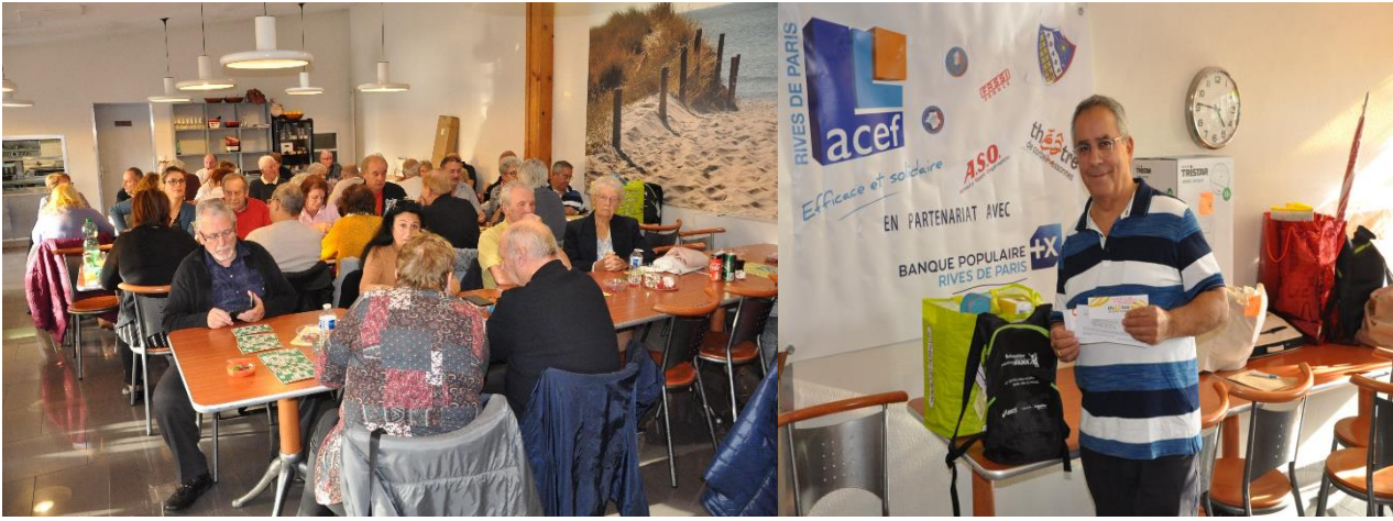
Clichés ci-dessus : vue générale des joueurs. A droite : l'un des principaux gagnants.